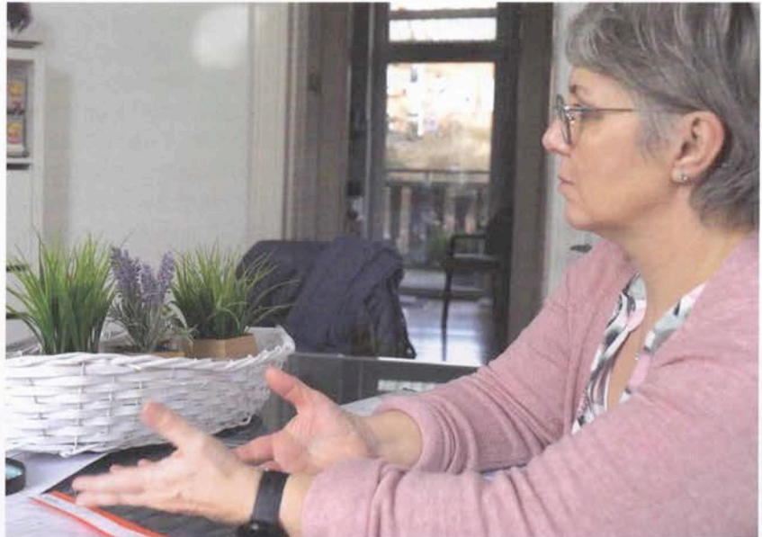
Szene aus dem Imagefilm: Beratung

Trotz des Umstandes, dass das Sterben häufig als Tabu-Thema gilt, haben sich sehr schnell drei Patient*innen und ihre Angehörigen dazu bereit erklärt, vor der Kamera von ihrer Situation, der Palliativversorgung und deren Ablauf zu berichten. Daraufhin wurden Termine für die Filmaufnahmen gemeinsam mit Patient*innen, Angehörigen, Mitarbeiter*innen, Kooperationspartner*innen und ehrenamtlichen Begleiter*innen organisiert. Die Dreharbeiten wurden mit sehr viel Feingefühl und Achtsamkeit von Michael Haak (M PLUS DESIGN)