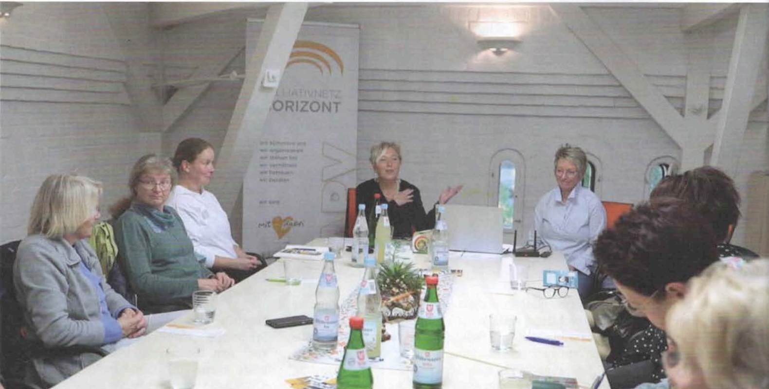
Szene aus dem Imagefilm: Teambesprechung

Auch in Zukunft wird es von großer Bedeutung sein, dass die Themen der Hospizarbeit und Palliativversorgung in der ausdifferenzierten Medienlandschaft und in der Öffentlichkeit präsent sind bzw. die Möglichkeiten hospizlicher Begleitung und palliativer Versorgung noch bekannter werden. Die Mittel und Wege, diese Ziele zu erreichen, sind dabei – in Zeiten von digitaler Kommunikation und Social Media – vielfältiger denn je. Die DHPStiftung hat ihren Stiftungspreis 2021 an Dienste und Einrichtungen vergeben, die mit besonders kreativen Maßnahmen, Aktionen, Kampagnen und Strategien eine breite Öffentlichkeit erreichen konnten – egal ob analog oder digital. Wir stellen die drei Gewinnerprojekte hier vor. Heute stellt das Palliativnetz Horizont aus Rendsburg das zweitplatzierte Projekt vor.